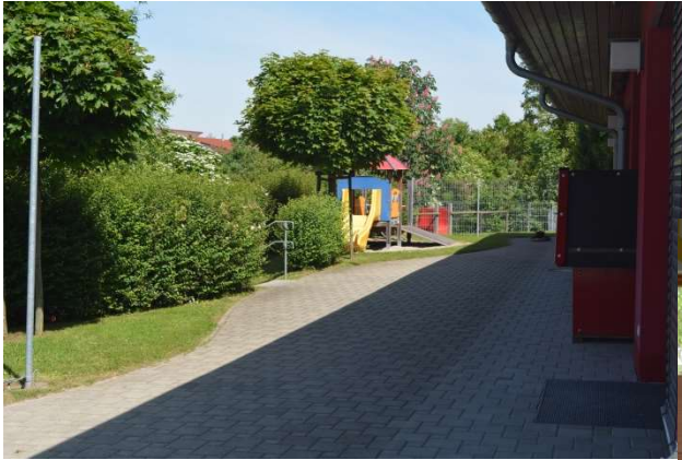
Sanitärbereich wird für viele verschiedene Tätigkeiten genutzt.

Der Außenbereich vor der Krippe ist dem Entwicklungsstand der 1-3-Jährigen entsprechend ausgestattet.