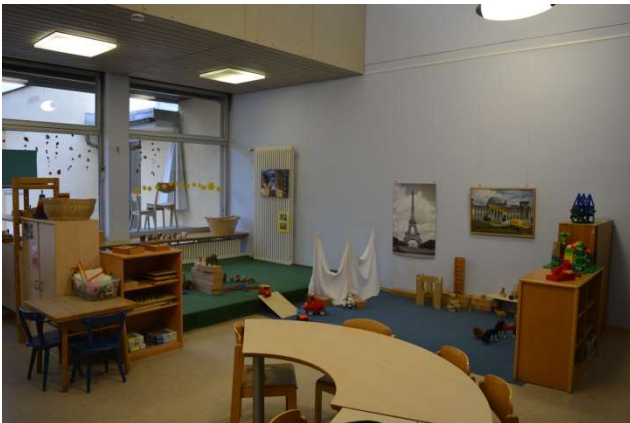
Nebenan finden wir das Bärenzimmer.