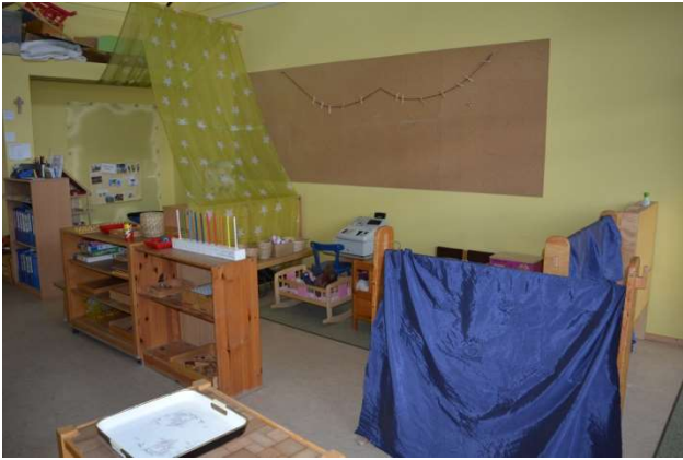
Danach gelangen wir in das Elefantenzimmer