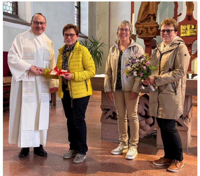
(Bericht & Bild: Kirchengemeinde)

Zugleich dankten sie ihr für die langjährige ehrenamtliche Mitarbeit bei zahlreichen Aktivitäten der Gemeinde und rege Unterstützung des Gemeindeteams und vormals des Pfarrgemeinderats. Für passenden Blumenschmuck in der Kirche St. Cyprian und Justina wird Frau Schilli weiterhin sorgen.