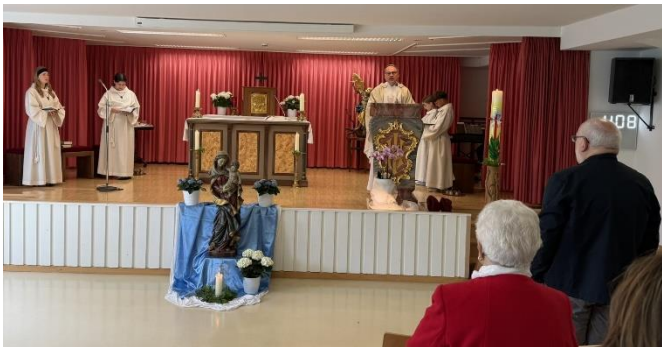
(Bericht & Bild: Rudi Rest)

Unter dem Motto „Hab Mut, steh auf“ steht der diesjährige deutsche Katholikentag, woran auch Pfarrer Josef Rösch in seiner Predigt anknüpfte. Wir alle sind mit der Taufe ein Stück weit verpflichtet, den Glauben weiterzugeben und uns für ihn einzusetzen. Die Rückkehr Jesu in den Himmel gilt als Versprechen, dass auch den Menschen der Weg zu Gott offensteht – und dass der Himmel überall sein kann.