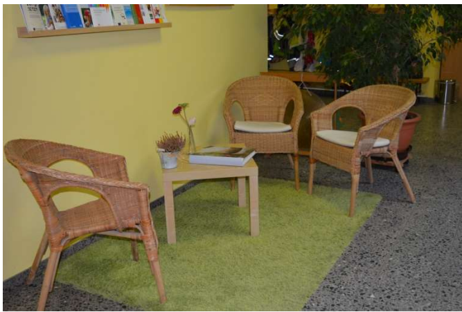
Für kurze Wartezeiten bieten wir eine Sitzecke an.

Im Büro empfängt Sie Frau Brüderle (Leiterin) beim Erstkontakt und für Anmeldegespräche.