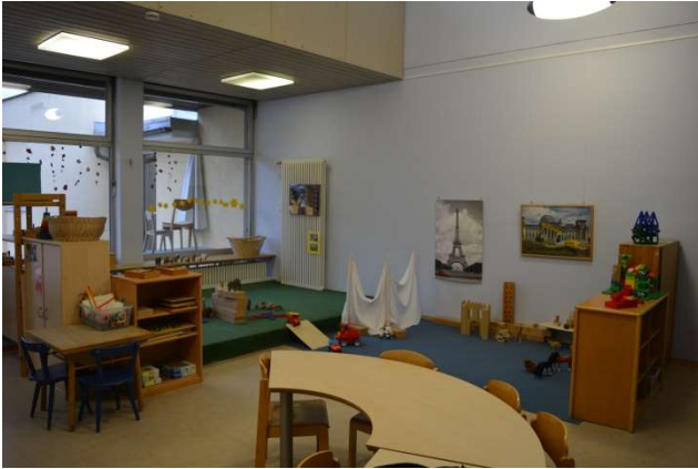
Nebenan finden wir das Bärenzimmer.